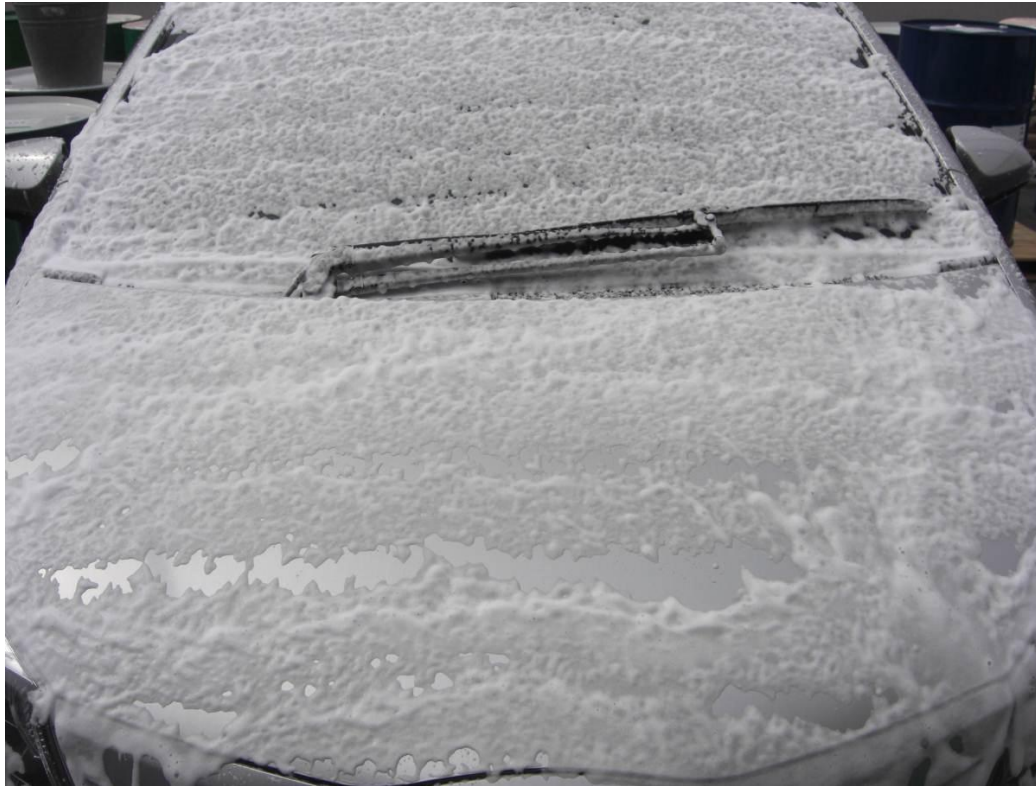
50倍希釈発泡エアースプレー塗布時